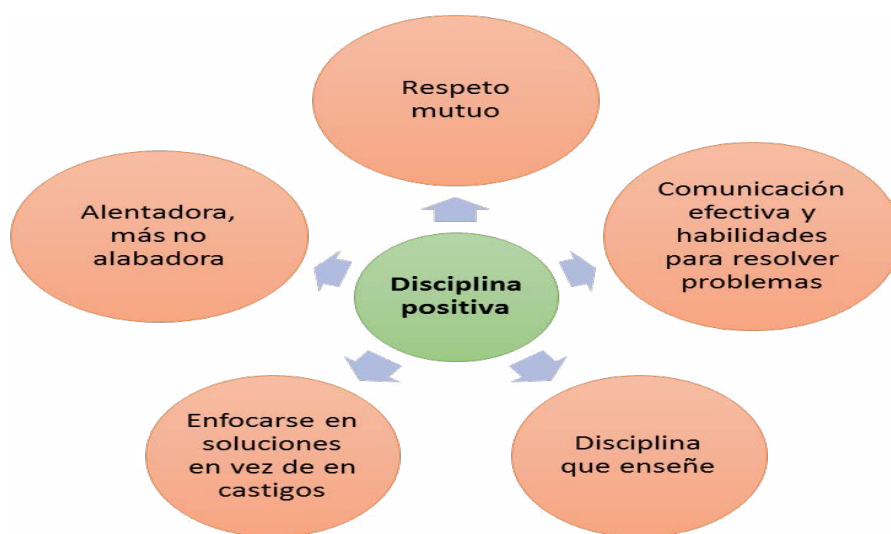
Figura 3. Conceptos relacionados con la disciplina positiva

La disciplina positiva se define como una herramienta metodológica que orienta a los adultos, padres de familia y docentes a actuar con firmeza y cariño con los niños y adolescentes. Se recomienda que, en situaciones de conflicto o de mal comportamiento, no se acuda al castigo ni a las acciones punitivas ni a la permisividad (Nelsen, 2018). Tal como se muestra en la Figura 3.