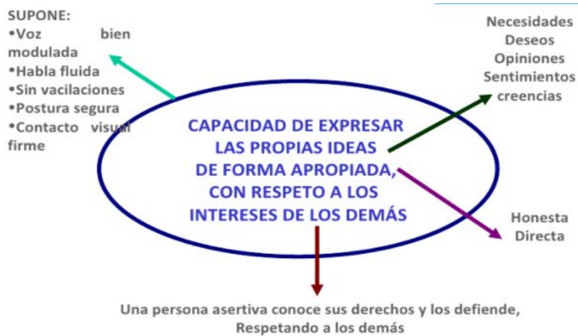
Figura 1. La asertividad

Al respecto, Hare (2003) plantea que la asertividad permite al niño ser quien es, decir lo que siente, y lo que cree de una manera directa, honesta y apropiada (p. 16). La Figura 1, sistematiza lo señalado.