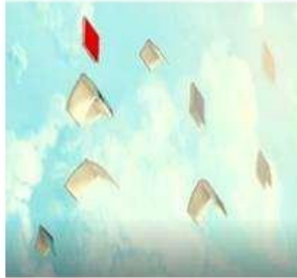
Imágenes tomadas del mejor corto