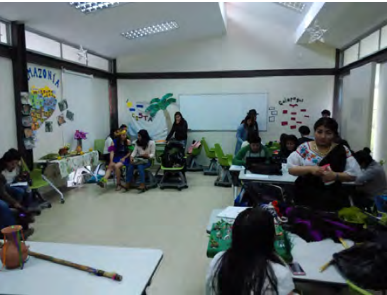
Figura 1: Las vestimentas y alimentos característicos de cada región nos acompañaron en esta enriquecedora experiencia en el aula, donde los alumnos nos sorprendieron gratamente “transportándonos” a cada uno de los lugares de estudio.

La experiencia valió para que todos los alumnos se implicasen en un proceso de aprendizaje e investigación de su propio país desde la perspectiva de estudio del medio natural y social, considerando el propio entorno como algo inclusivo, donde sociedad y medio ambiente van de la mano y sobre todo planteándose el reto de cómo comunicar y transmitir ese conocimiento en un aula.