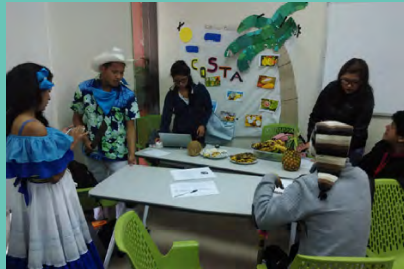
Figura 4: La originalidad estuvo presente en ambas sesiones de clase de principio a fin. Manteniendo la sorpresa y la curiosidad a flor de piel en lo que fue una inmersión en la cultura y la riqueza de cada una de las regiones del Ecuador.