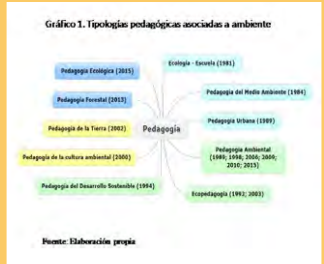
Gráfico 1. Tipologías pedagógicas asociadas a ambiente.